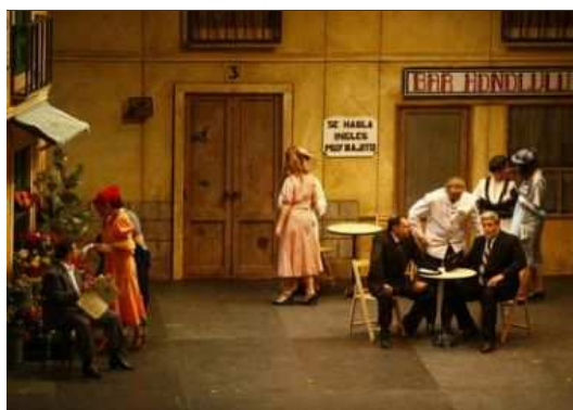
Una escena de «La del manojo de rosas», en el Auditorio DL

La lírica en León ha gozado siempre de una muy buena salud y la prueba de ello ha sido el lleno absoluto que cosechó una vez más el recién concluido miniciclo de tres zarzuelas dedicadas al maestro guipuzcoano Pablo Sorozábal. Tres títulos del más conocido repertorio como La del manojo de rosas , La tabernera del puerto y Katuska , son tres zarzuelas que atraen como la miel a las moscas, a cualquier aficionado al «género chico» y si todo ello se adoba con una compañía correcta y unos músicos en consonancia, entonces el éxito está asegurado como así fue.